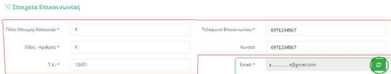
Εικ.2_Απευθείας τροποποιούμενα πεδία από τον υποψήφιο

«Πόλη Μόνιμης Κατοικίας» – «Οδός-Αριθμός» – «Τ.Κ.» – «Τηλέφωνο Επικοινωνίας» – «Κινητό»