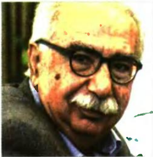
Τη συνέντευξη πήρε η Τζέλια Αλιπράντη

Ο πρωθυπουργός εξήγγειλε στη ΔΕΘ μια σειρά βελτιώσεων για κάποιες μνημονιακές πολιτικές. Η ΝΔ έχει σπεύσει να τις χαρακτηρίσει σαν παραχολογίες. Πώς σχολιάζετε αυτή τη στάση;