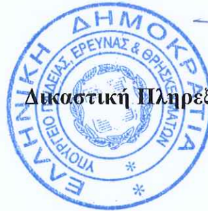
Ευσταθία Ντάλη Δικαστική Πληρεξούσια Α΄ Ν.Σ.Κ.