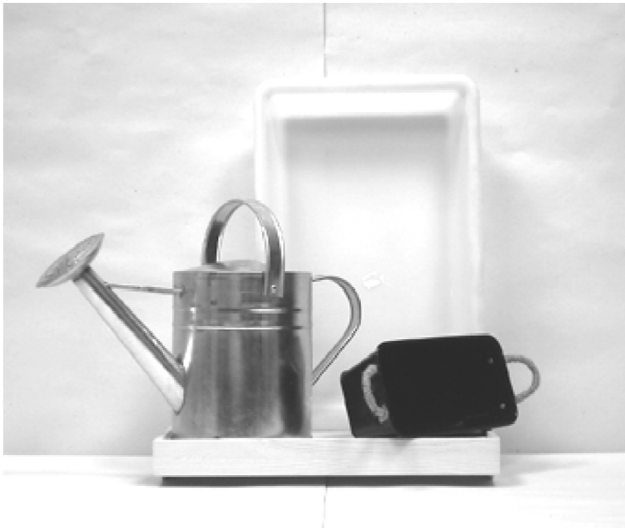
πρώτη φωτογραφία: μπροστινή όψη