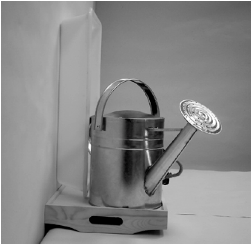
τρίτη φωτογραφία: πλάγια όψη