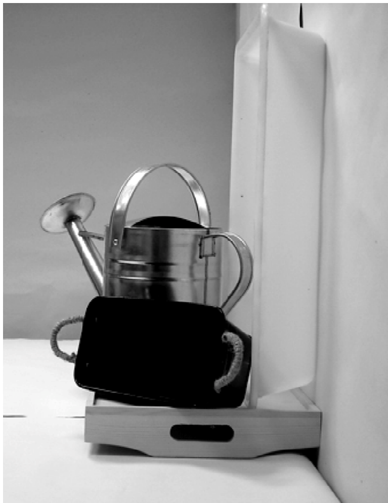
τέταρτη φωτογραφία: πλάγια όψη